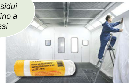
ECP812-270/16 – Rotolo film bianco + nastro giallo

Il nastro non lascia residui di colla fino a 5 mesi