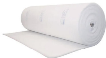
TA883 – Filtro cielo per cabine di verniciatura